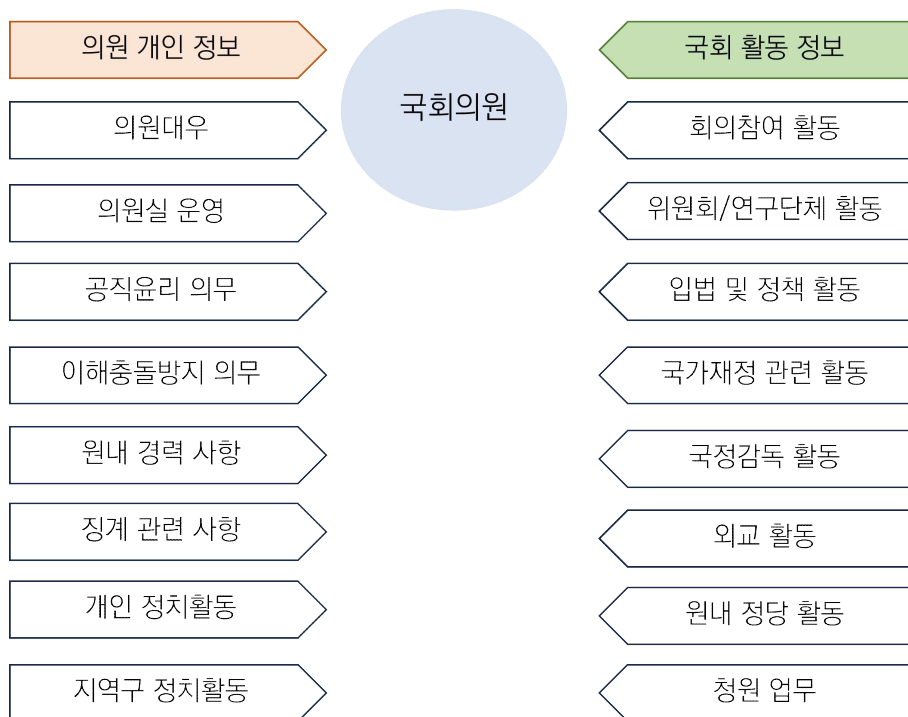
〈그림 2〉 국회의원 의정활동 관련 정보 영역

○ 국회의원의 의정활동 관련 생산·접수되는 정보는 1) 의원 개인이나 의원실에 관계된