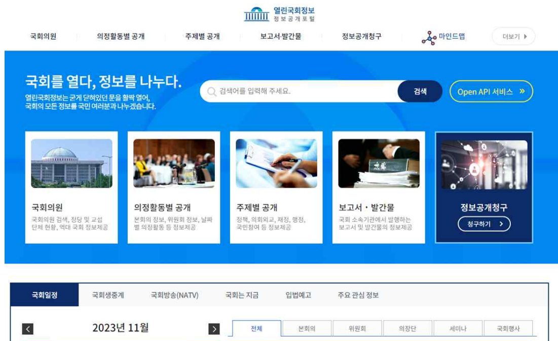
〈그림 7〉 열린국회정보 시스템