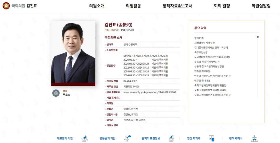
〈그림 3〉 국회 제공 국회의원 개인 홈페이지 사례